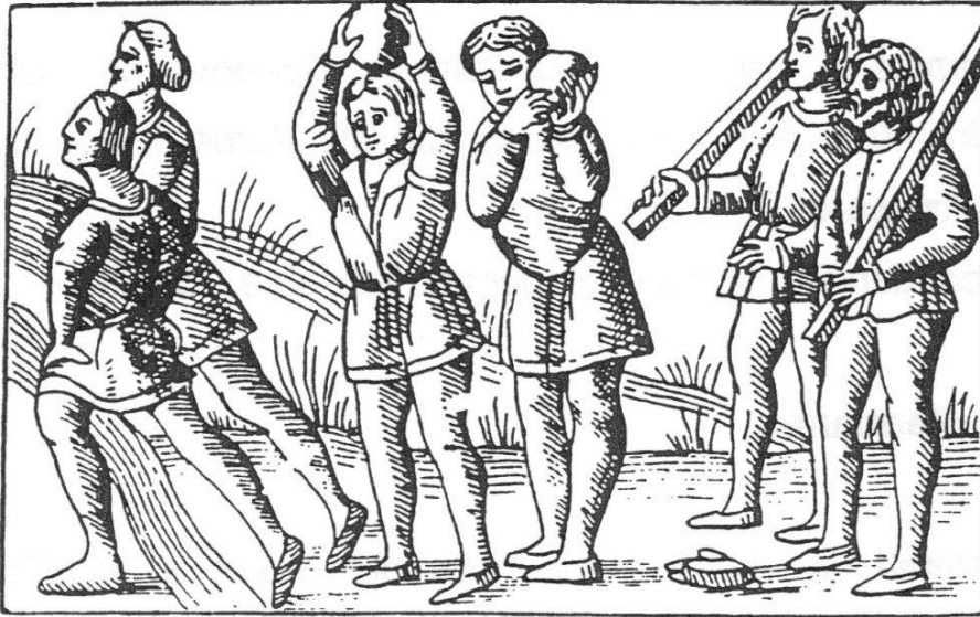
Abbildung 5:Steinstoßer im Mittelalter

daß das einfache Volk seine gewöhnlichen Tätigkeiten nicht auf das damals wertvolle Papier aufzeichnete. 8