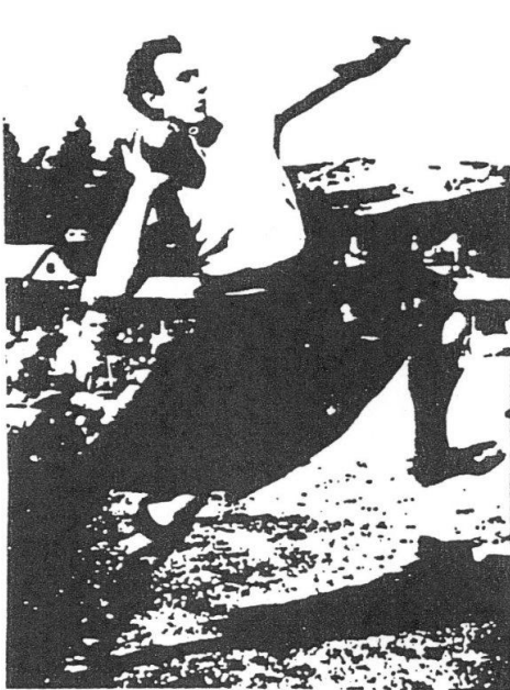
Abbildung 7: Steinstoßen auf den Highland Games

„Gestoßen werden darf der Stein nur mit einer Hand aus einer Position, in der er sich vor der Schulter befindet. Die Abwurfbegrenzung stellt ein Holzbalken dar. Die Anlaufphase darf nicht länger als 7 ft. 6 ins. (2,30 m) sein.“ 30